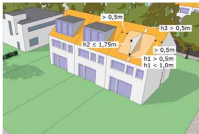
Een dakkapel die voldoet aan de in bovenstaand tekening gegeven afmetingen mag zonder omgevingsvergunning geplaatst worden

In de planologische regelgeving (bestemmingsplan of beheersverordening) legt de overheid regels vast voor de ruimtelijke ordening. Deze regels zijn bindend voor u als burger. In een bestemmingsplan of beheersverordening is aangegeven welke bestemming de grond heeft en welk gebruik is toegestaan. Bijvoorbeeld woningbouw, industrie, winkels, recreatie of kantoren. Die verschillende bestemmingen zijn op een plankaart weergegeven en in de planvoorschriften zijn de daarbij behorende regels voor het bouwen en het gebruik gegeven. Tenzij uw bouwplan vergunningvrij is, moet voldaan worden aan die bouw- en gebruiksregels.